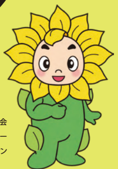
兵庫県弁護士会 イメージキャラクター ヒマリオン