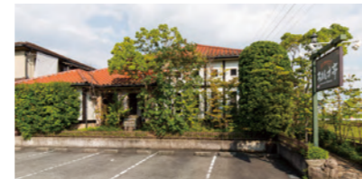
笹塚古墳すぐ前の閑静な住宅街にたたずむ隠れ家的レストラン。レンガ色の屋根が目立ち、お洒落で豪華な一軒家といった印象だ。

い。磯巻きとんかつは必須というお客様が多いというのも肯ける、ここだけにしかない味わいだ。