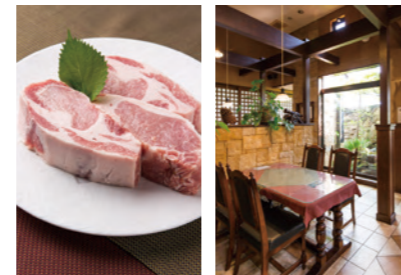
細かなサジが入っているのが「神戸ポークプレミアム」の特長。肉質は軟らかく甘みがあり、脂がサラリとしている。落ち着いた雰囲気や温う店内、テーブルごとに仕切られているので、個室感覚でゆったり食事を楽しむことができる。