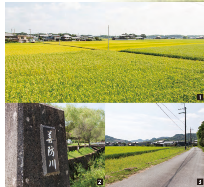
[1]内陸部ながら平地が広い加西市は、古くから稲作が盛ん。稲刈りは9月～10月中旬がピーク。[2]国道372号に沿って善防川が通っている。[3]美しい田園風景に心が和む。

善防の信号を右折、国道372号に沿って歩く。少し行くと、焼き杉板造りの酒蔵に出会う。播磨の銘酒「富久錦」の蔵だ。加西産の良質な酒米と、蔵の井戸から汲み上げた軟水の自然水を原料にした“純米酒”だけを醸しているのが看板。小さな蔵だからこそ可能な、米本来の旨味が感じられる良質な酒造りが行われている。