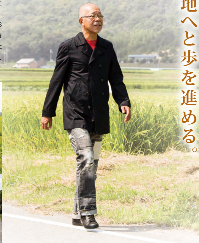
豊かな自然、肥沃な土壌を身体全体で感じながら歩む。コースは、やがて山道に差し掛かる。