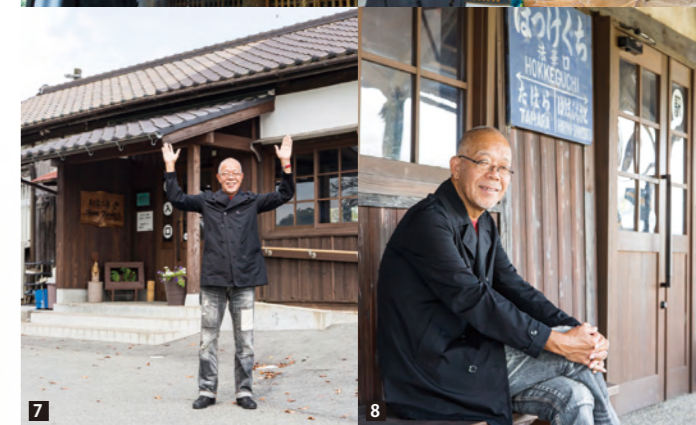
[1]今年の爽りはどうだったろう？[2]石段に沿って境内が広がる法華山一乗寺。[3]上に行くほど屋根が小さくなるよう造られた三重塔。安定感のある優美な姿。[4]中世仏堂形式を伝える本堂。回廊から見下ろす紅葉に染まる景色が素晴らしい。[5]一乗寺の本尊は重文指定、白鳳時代の聖観世音菩薩。[6]平安時代から変わらず、巡礼の霊場として信仰を集める一乗寺。[7]大正初期に建造された法華山口駅に無事ゴール。[8]温もりある木造駅舎に腰を下ろせば、時がゆるやかに流れていく。