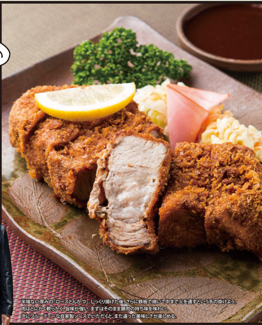
半端ない厚みの「ロースとんかつ」。じっくり揚げた後、さらに鉄板で焼いて中まで火を通すという手の掛けよう。肉はどろどろと軟らかく、旨味が強い。まずはそのまま豚肉の持ち味を味わい、次にフルーティーな自家製ソースでいただく、また違った美味しさが楽しめる。

【営】11:30~14:15 (L.O.)、17:30~20:15 (L.O.)