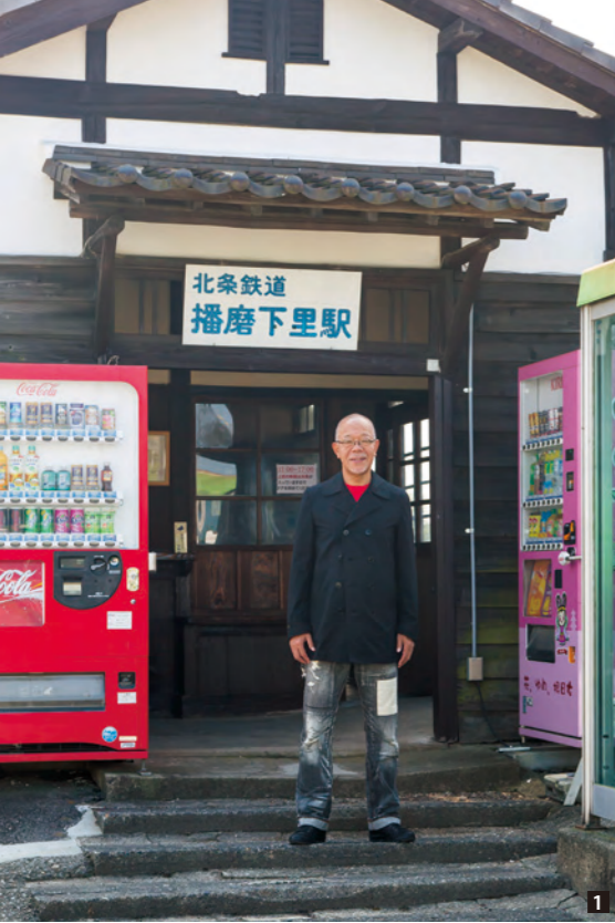
[1]レトロ感いっぱいの北条鉄道・播磨下里駅。どこか懐かしい田舎の駅といった印象。[2]北条鉄道は、上りも下りも大体1時間に1本。利用する場合は、WEBなどで時刻表を確かめよう。古い駅舎を歩けば、タイムスリップしそうな気がする。