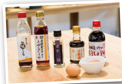
蔵ごとに味の違う醤油。醤油の郷・龍野らしく、食卓の掛け醤油も常に4〜5種類用意されていて、自分好みの卵かけご飯を追求できる。ショップで醤油のテイストにもチャレンジしてみよう。

旧龍野醤油同業組合事務所だったモダンな洋館“醤油の郷 大正ロマン館”に隣接して建つ「クラテラスたつの」。大正時代の醤油蔵を、梁などの部材を活かしてリノベーションしたもので、地産地消カフェ、地場産品ショップ、ワークショップスペースから成っている。