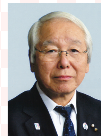
兵庫県知事 井戸敏三 Toshizo Ido