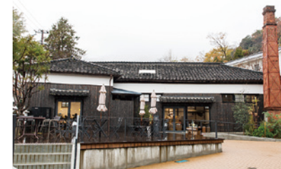
店名どおり、表に設えた広いテラスが特徴。漆喰の白壁、黒板壁、レンガの煙突が、かつて醤油蔵だったことを物語る。

ワークショップでは、月2回、レザークラフト、my醤油づくりの体験講座を開催。「定期的に甘酒の活用法など発酵文化の魅力を発信しているのも龍野ならではの良さではないでしょうか。」