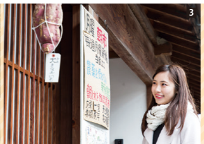
[1] 十文字川沿いの細い道。龍野の城下町は趣深い路地が多い。[2] 龍野は兵庫県の景観形成指定地区。江戸時代の町家から、大正・昭和初期のモダンな建物まで、さまざまな建築物が現存。[3] 軒先に野菜をぶら下げ、産直販売の日程を告知。