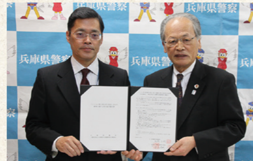
兵庫県警察本部西影地域部長と松尾会長