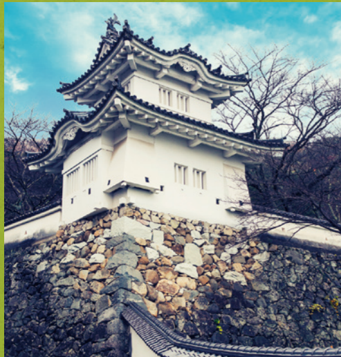
▶表紙写真:城下から見上げた龍野城