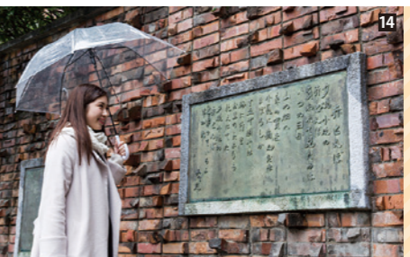
[4] 城の南には寺院が集中して寺町を形成。立派な山門をもつ寺も。[5] 丸や三角の鉄砲狭間を覗いてみる。[6] 復元された隅櫓と白塀は、龍野城を代表する景観だ。[7] [8] 鏝塗などが飾られた本丸御殿。自由に内部を見学できる。[9] [10] 龍野城埋門のすぐ南に建つ三木露風の生家。露風は6歳までをここで過ごした。[11] 大正時代の醤油蔵を改装、カフェやショップとして活用。[12] 龍野の町では現在も7社の醤油醸造工場が稼働。古い醤油蔵も残っている。[13] 浦川沿いに建つ如来寺。境内に露風の塚もある。[14] 露風が作った赤とんぼの歌詞を刻んだ歌碑。前に立つとメロディーが流れる。