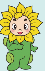
兵庫県弁護士会 イメージキャラクター ヒマリオン