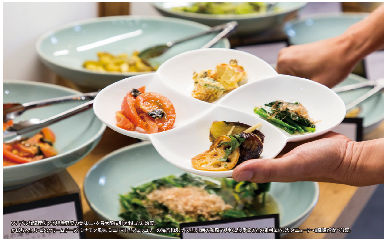
シブブシな調理法で地場産野菜の美味しさを最大限に引き出したお惣菜。かぼちゃとリンゴのクリームチーズ・シナモン風味、ミニトマトとブロッコリーの海苔和え、ナズとしし唐の和風マリネなど、季節ごとの素材に応じたメニュー7〜8種類が食べ放題。

HYOGO takken press ひょうご宅建プレス Vol.323 2019.1月発行