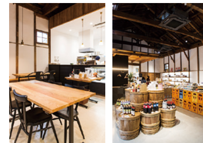
天井が高く開放的なショップ空間。醤油、そうめん、皮革と、たつの市の三大地場産品全てが揃っているのはここだけ。