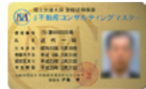
ゴールドカード (更新2回目以降の方)

不動産流通近代化センターは、公認 不動産コンサルティングマスター認定後も継続学習により、知識だけでなく実践力を身につけられる場を提供します!