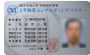
シルバーカード (初回認定、更新1回目の方)