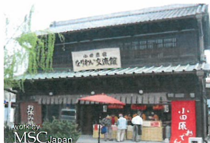
小田原宿なりわい交流館