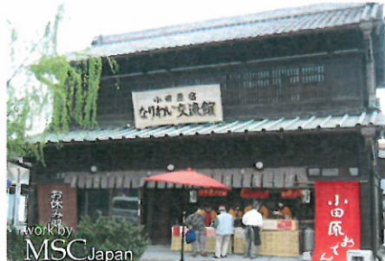
小田原宿なりわい交流館