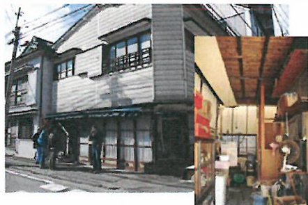
元染物店(10年間無人)