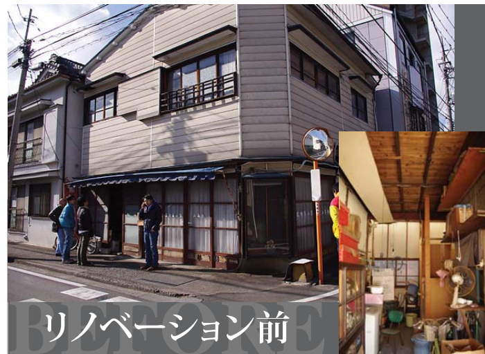
リノベーション前