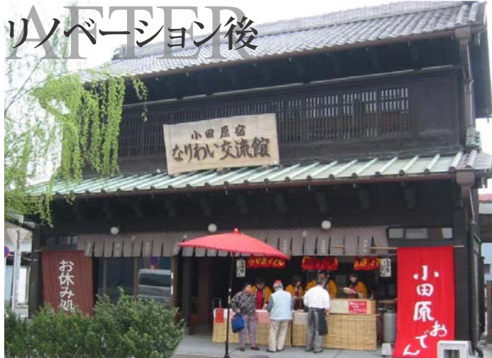
リノベーション後