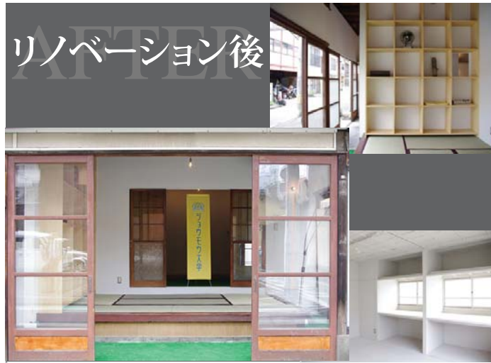
リノベーション後