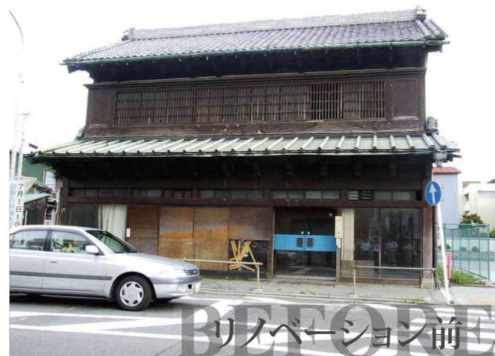
リノベーション前