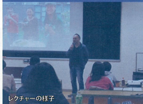
レクチャーの様子