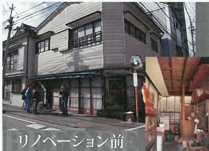
リノベーション前