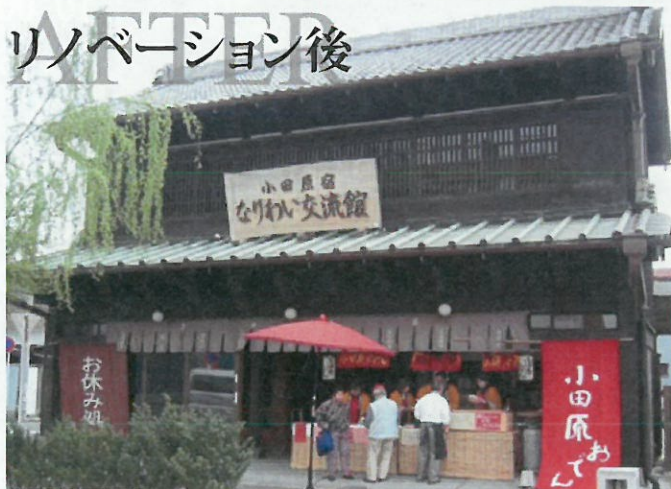
リノベーション後