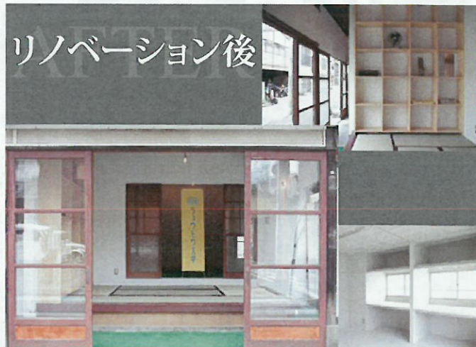
リノベーション後