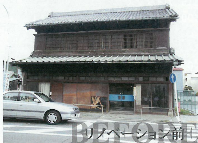
リノベーション前