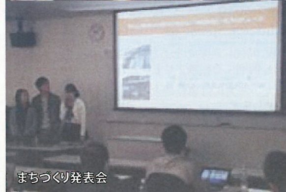
まちづくり発表会