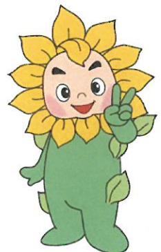
兵庫県弁護士会 イメージキャラクター ヒマリオン