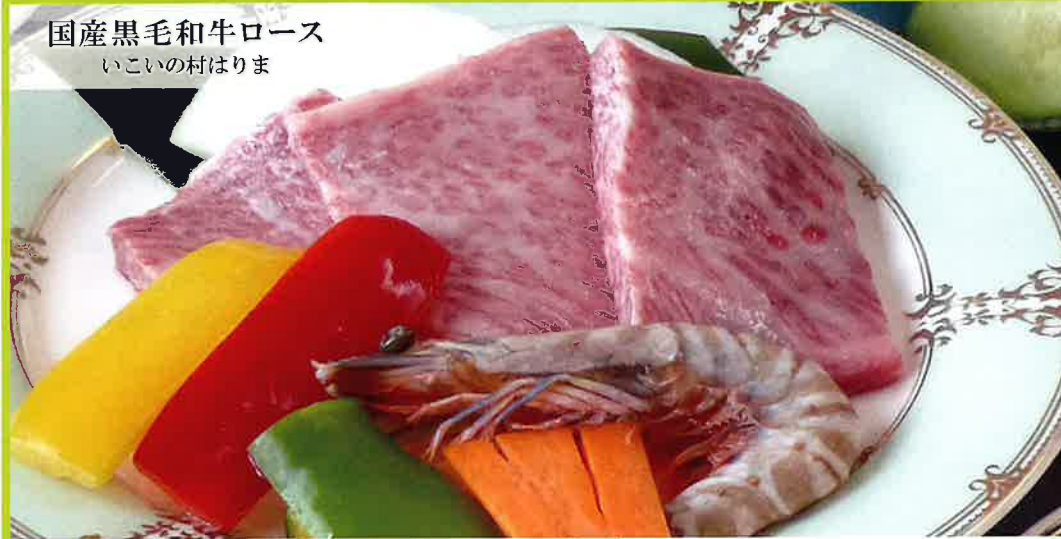
国産黒毛和牛ロース いこいの村はりま