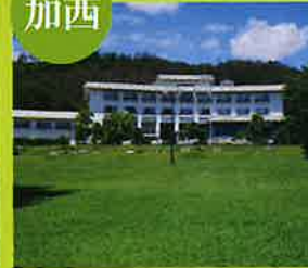
いこいの村はりま