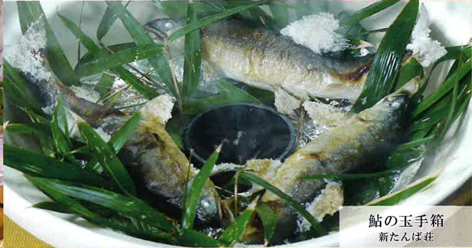
鮎の玉手箱 新たんば荘