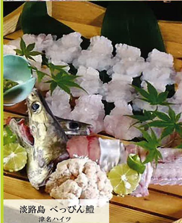
淡路島 ベっぴん鱧 津名ハイツ